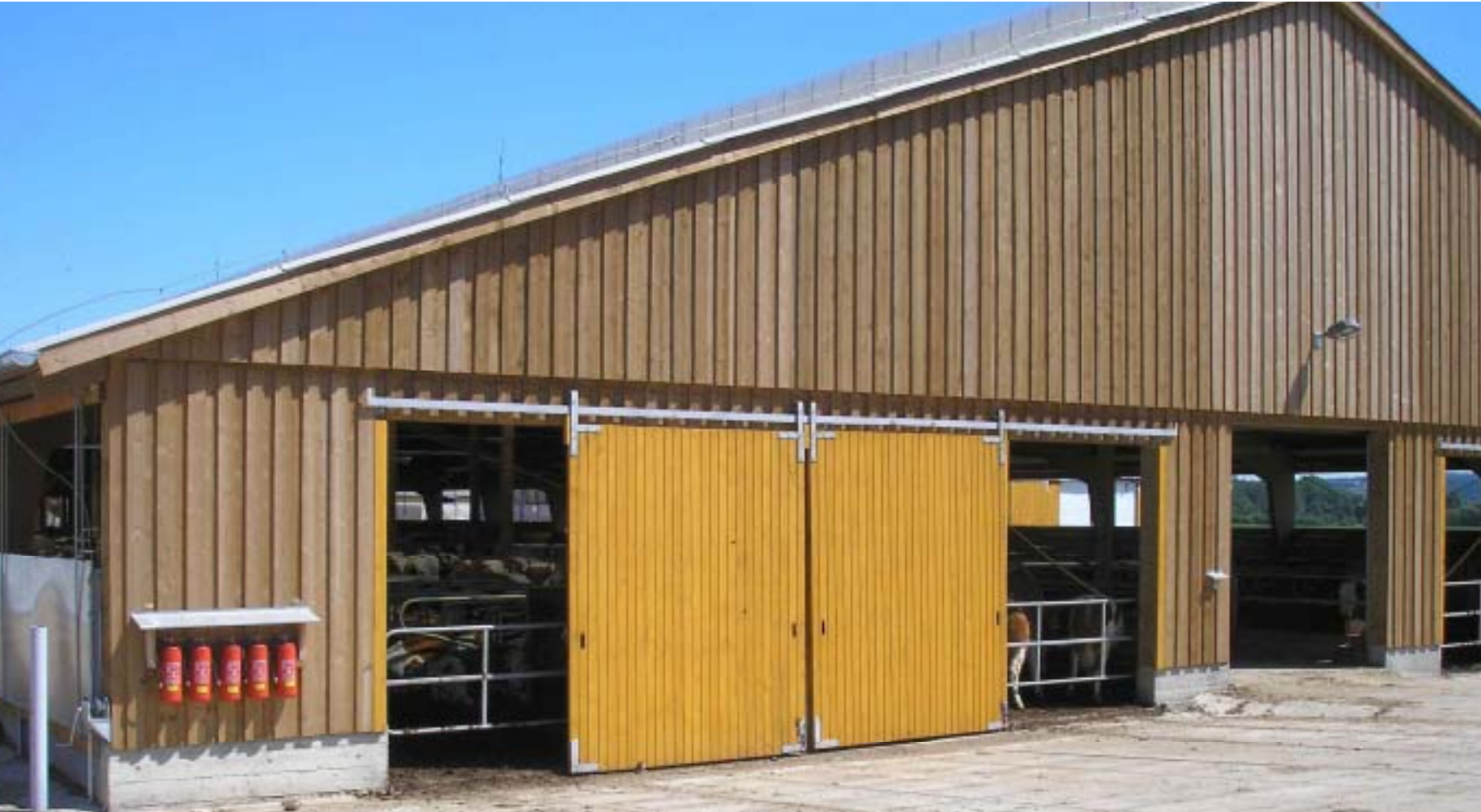
Agrochov Kasejovice, ŠCH Mladý Smolivec